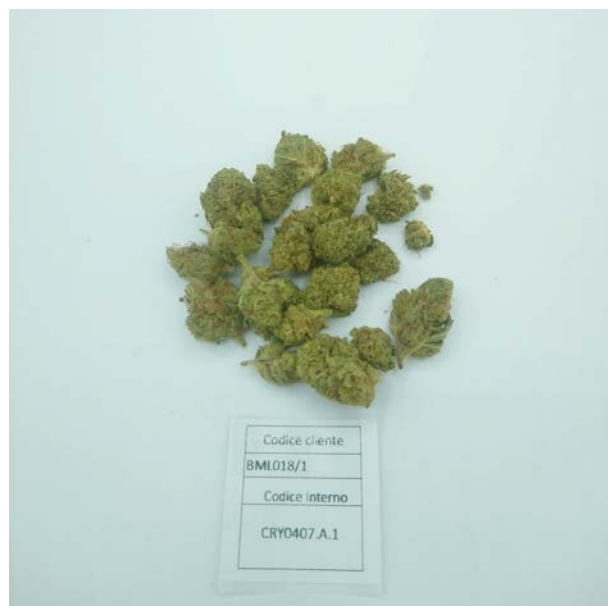
ÉCHANTILLON ANALYSE: Muka 76(3.00gr)