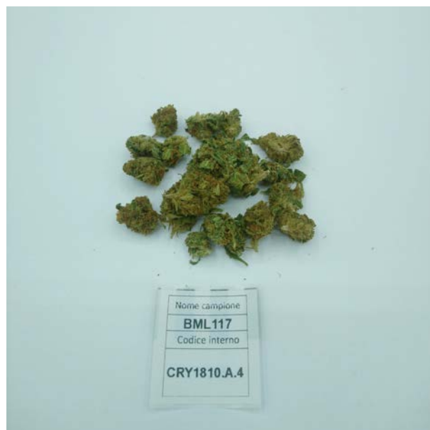
ÉCHANTILLON ANALYSE: Finola(3.00gr)