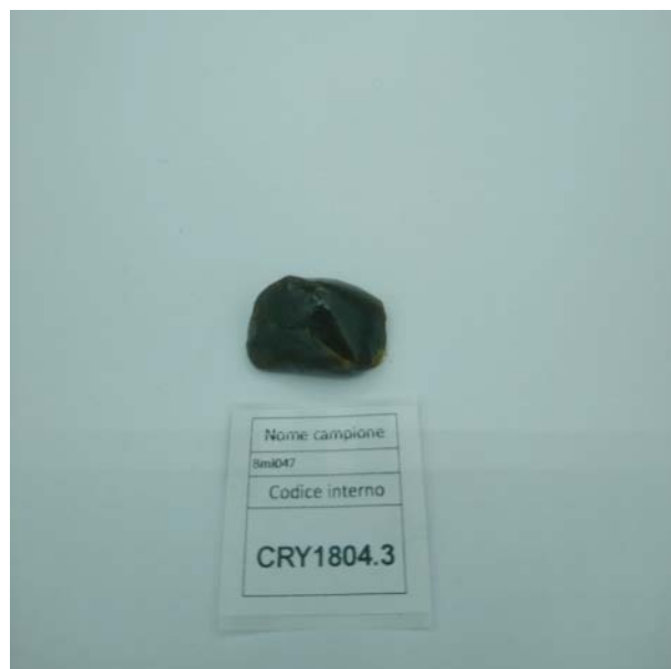
ÉCHANTILLON ANALYSE: Finola(3.00gr)