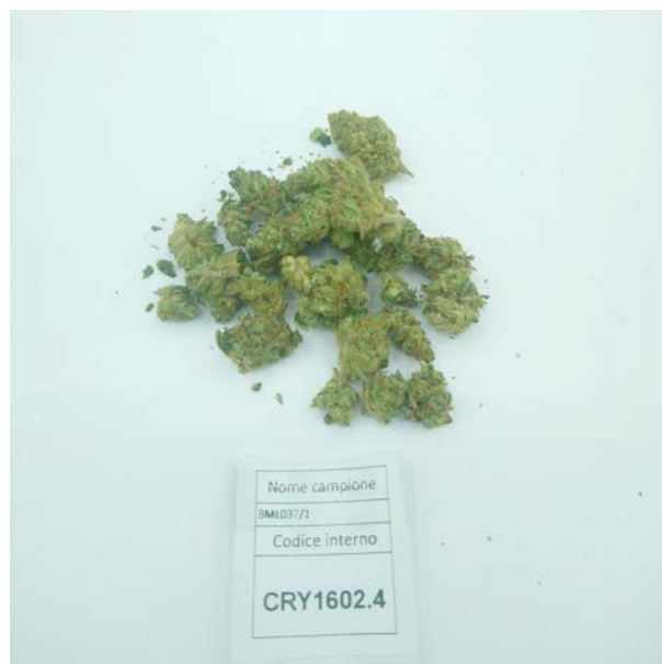
ÉCHANTILLON ANALYSE: Tiborszallasi(3.00gr)