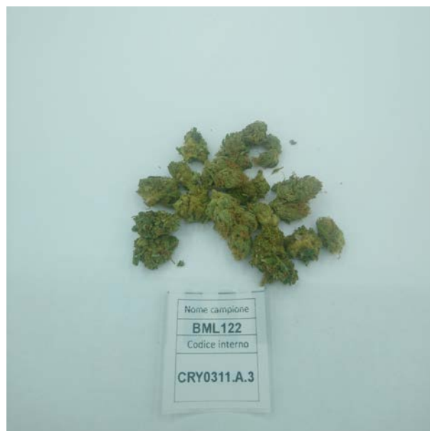
ÉCHANTILLON ANALYSE: Finola(3.00gr)