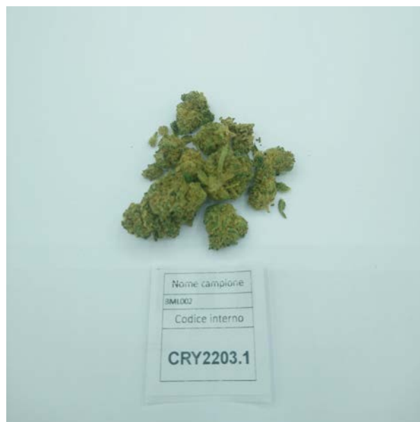
ÉCHANTILLON ANALYSE: Finola(3.00gr)