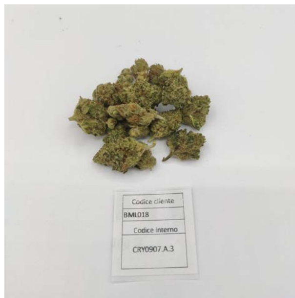
ÉCHANTILLON ANALYSE: Muka 76 (3.00gr)