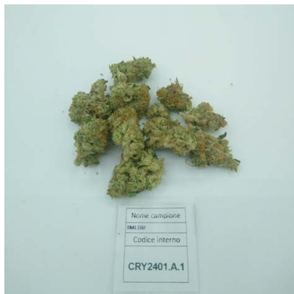
ÉCHANTILLON ANALYSE: Fibranova (3.00gr)