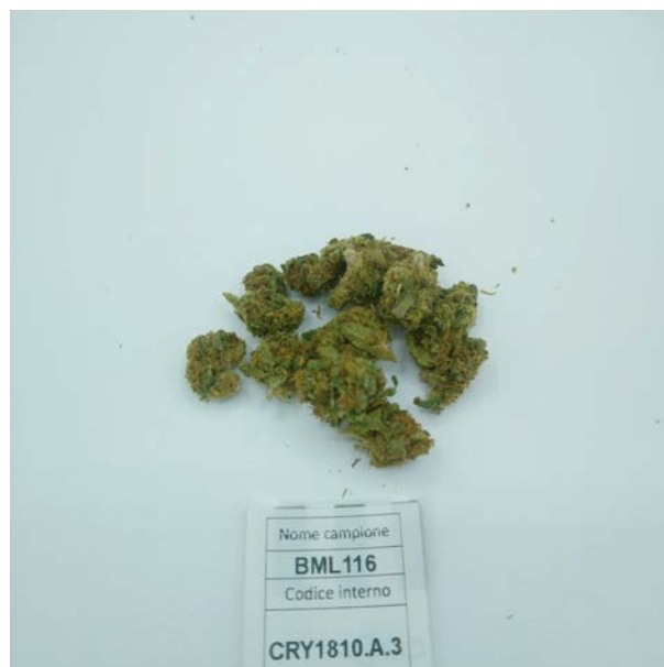
ÉCHANTILLON ANALYSE: Santhica 27 (3.00gr)