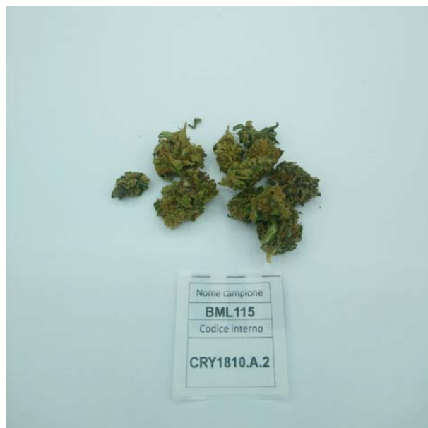
ÉCHANTILLON ANALYSE: CS (3.00gr)