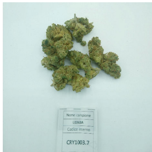
ÉCHANTILLON ANALYSE : Finola (3,00gr)