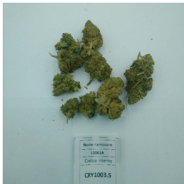
ÉCHANTILLON ANALYSE : Silvana (3,00gr)