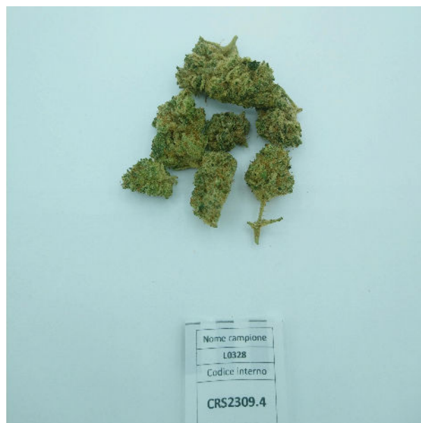
ÉCHANTILLON ANALYSE : Kompolti (3,00gr)