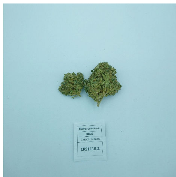
ÉCHANTILLON ANALYSE : Finola (3,00gr)