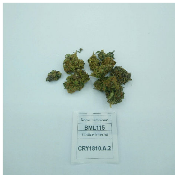
ÉCHANTILLON ANALYSE : CS(3.00gr)