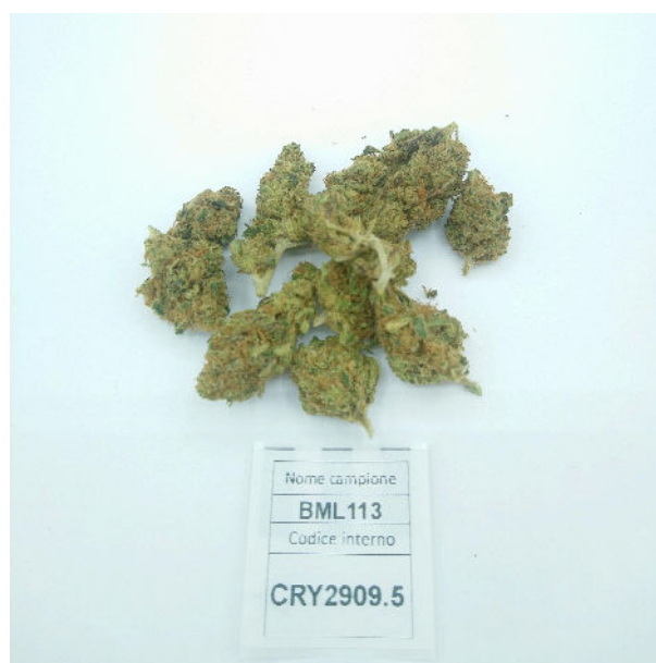
ÉCHANTILLON ANALYSE : Santhica 27(3.00gr)