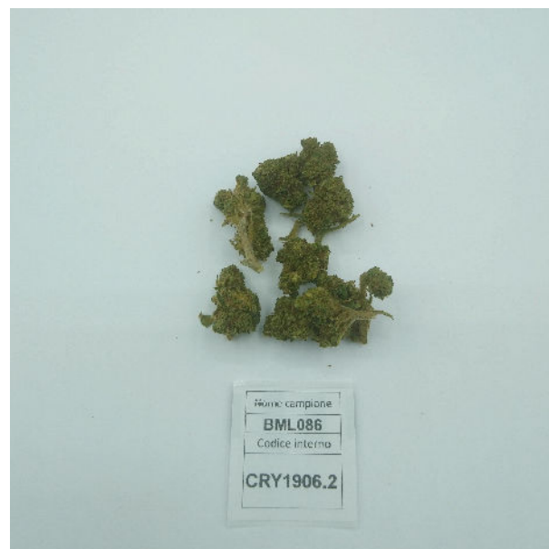
ÉCHANTILLON ANALYSE : Tisza (3,00gr)