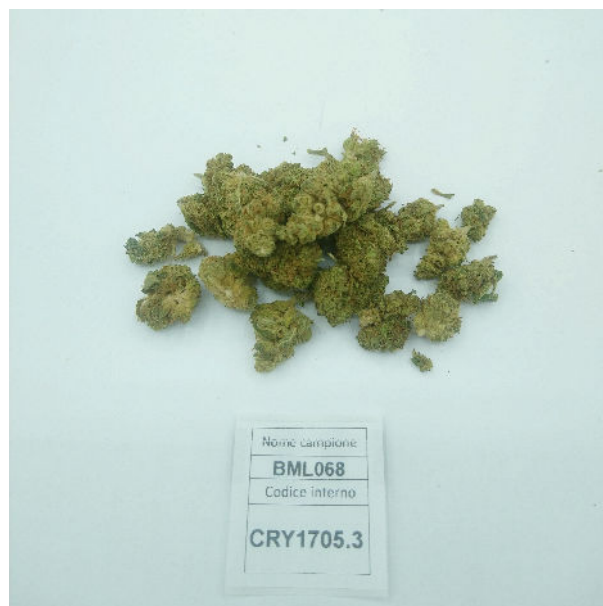
ÉCHANTILLON ANALYSE : Eletta Campana (3,00gr)